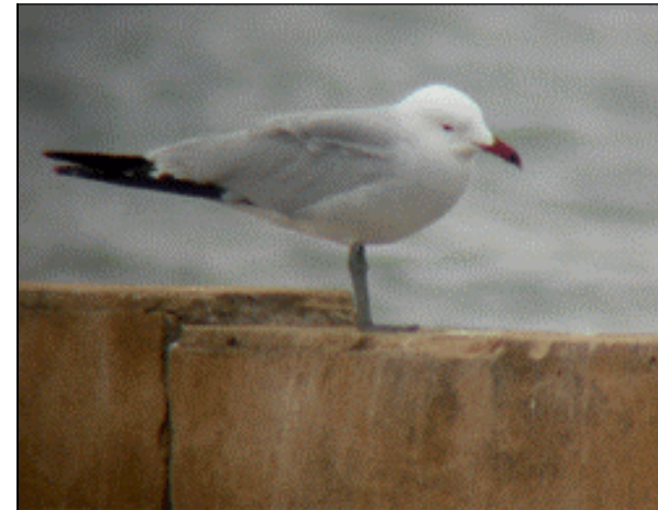
Gavina corsa ( Larus audouinii )

Des de l'any 1978 es venen fent censos irregulars de l'espècie que s'intenten recollir en la següent taula i gràfic per tal de fer un seguiment de la població menorquina de l'espècie.