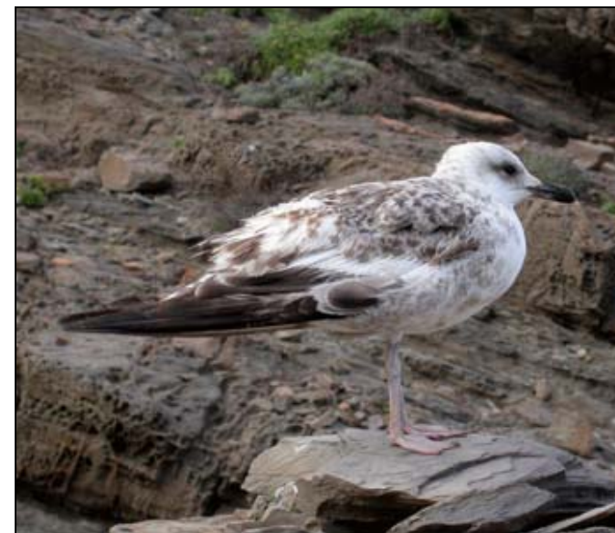
Immadur de gavina corsa ( Larus audouinii ).

+ : Cens complet, recomptes en totes les colònies conegudes.