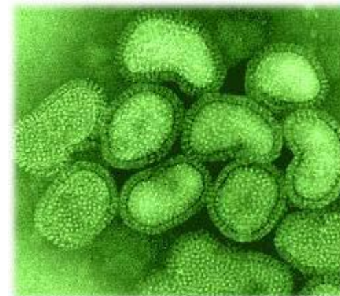
Virus del grip

La informació que es presenta a continuació prové dels informes 2003-2016 de la Xarxa de Vigilància Epidemiològica de les Illes Balears . S'ofereix la incidència del virus del grip en les illes mesurada tant en nombre absolut de casos diagnosticats pels serveis de salut, com la taxa per cada 100.000 habitants. Per les taxes s'utilitza la xifra de població de l'actualització del Padró Municipal d'Habitants. Es presenta també l'índex epidèmic (IE), relació entre el nombre anual de casos observat i la mediana dels casos anuals detectats el quinquenni anterior. En funció dels casos observats els darrers cinc anys, aquest indicador permet avaluar la incidència observada com a l'esperada si IE es troba en l'interval (0,76 - 1,24), o determinar que la incidència observada es troba per sota o per sobre de l'esperada en cas que IE quedi fora d'aquest interval, per sota o per sobre respectivament.