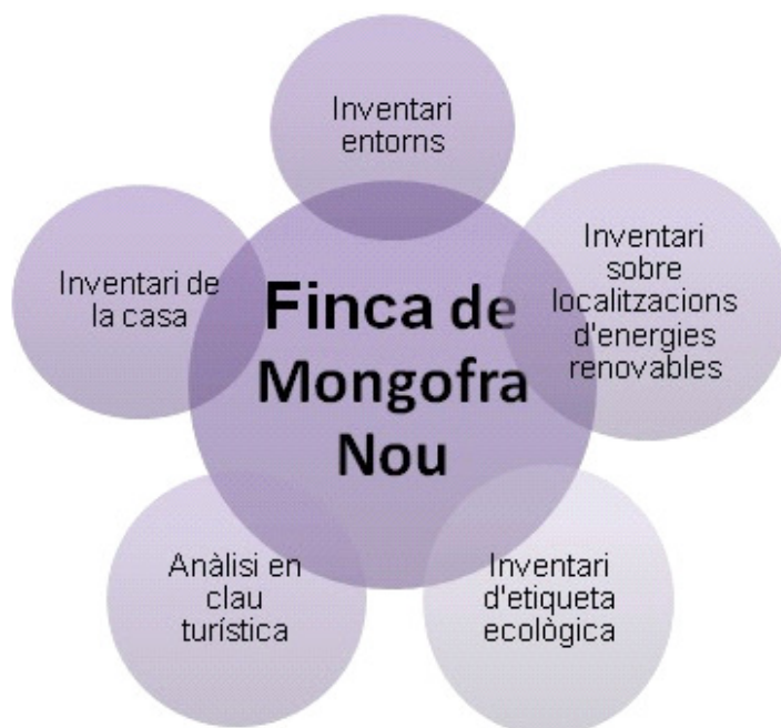
Fig. 3. Estructura de l'inventari de la finca de Mongofra.

Per oferir una proposta turística el més coherent possible s'han realitzat una sèrie d'anàlisis relacionades amb la finca de Mongofra Nou (Fig. 3)